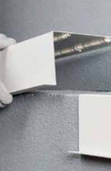
Unión elástica de elementos constructivos