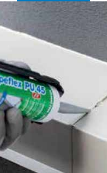
Sellado elástico de juntas de construcción

Mapeflex PU 45 FT endurece por reacción con la humedad atmosférica y, gracias a sus características, ofrece elevadas garantías de durabilidad, pudiéndose emplear tanto sobre superficies horizontales como verticales. El producto se presenta listo para usar y está disponible en cartuchos metálicos y en salchichones, que permiten una práctica y fácil aplicación por medio de las pistolas de extrusión adecuadas. Su consistencia permite una rápida puesta en obra y, gracias a su rápido endurecimiento, una puesta en servicio en poco tiempo, con las consiguientes ventajas económicas. En caso de sobrepintado de Mapeflex PU 45 FT , el sellador debe presentarse completamente polimerizado. Se aconseja utilizar una pintura elastomérica como Elastocolor Pittura , previo tratamiento de la superficie del sellador polimerizado con Colorite Performance . Realizar siempre pruebas previas de compatibilidad entre el sellador y la pintura.